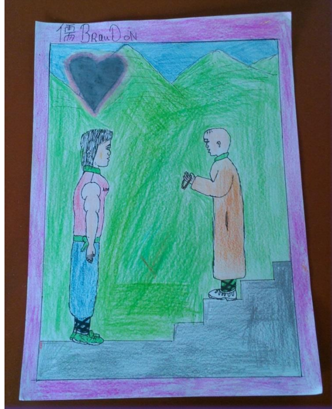
阿儒說~這是小北教練 (手臂有肌肉) 在聽師父開示